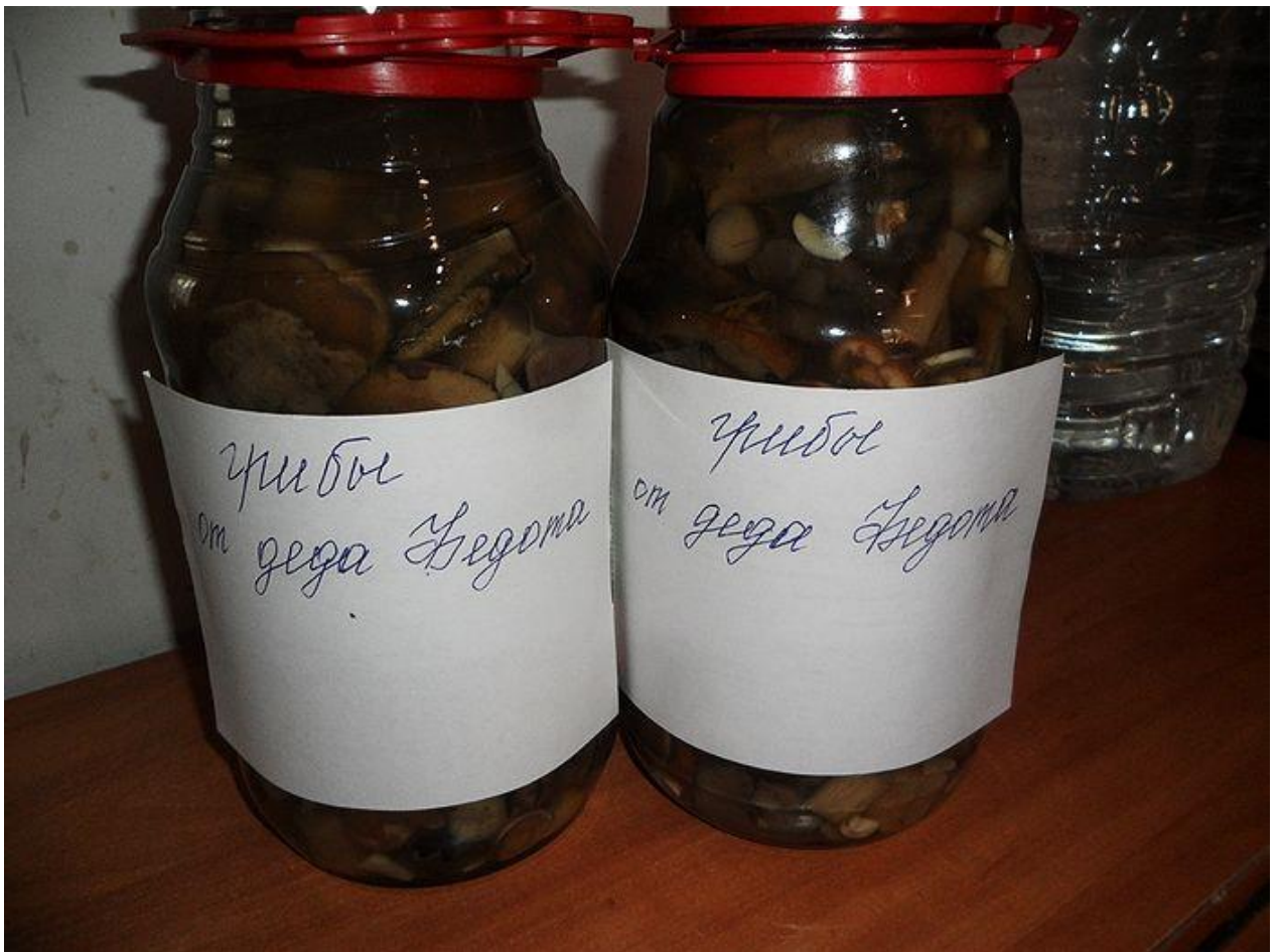
Наш урожай на память

– Больше таких видений, думаем, не будет, – сказали мы. – Мы сегодня ИХ ВСЕХ отпели и предали земле, и крест ИМ ВСЕМ поставили.