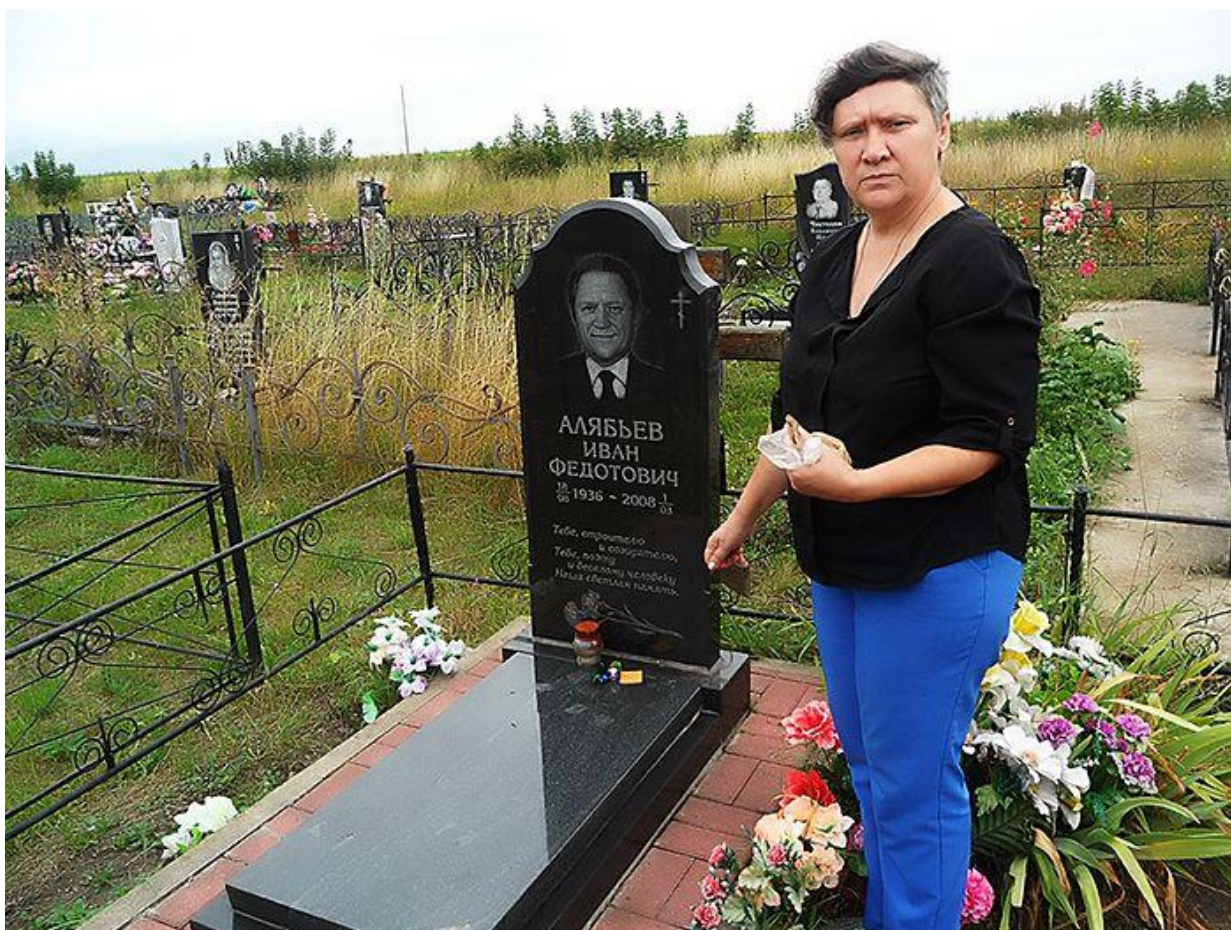
Земля с Раздельной на могилу моего папы

Как представители всех потомков многих сотен погребенных на станции Раздельная, в безвестных могилах на лесном кладбище, мы поставили Поклонный крест — хотя бы один на всех. Ведь ниточки памяти, обрубленные силой безбожной жестокости, ведут от этой лесной глухомани во все концы бывшего СССР. Только не знают потомки узников, где искать их могилы, и потому наш крест пока будет с одной именной табличкой — нашего деда. Но, может быть, еще кто-то подвигнется на поиск, и тогда проделанный нами труд послужит облегчением чьих-то попыток почтить память своего предка. Приедут, помолятся, и появятся на нашем общем кресте еще и еще таблички с именами.