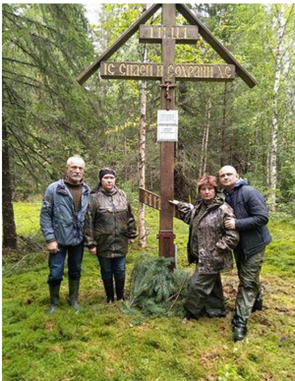
Поклонный крест узникам ОЛП-13