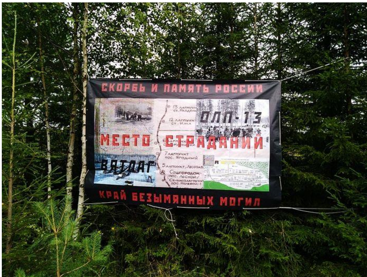
Баннер установили на повороте на Гидаевскую ветку

После установки креста взялись за баннер. Его решили растянуть на деревьях прямо у съезда на Гидаевскую ветку. Подогнали наш ЗИЛ (к нему все мы прониклись бесконечной любовью и уважением!) и с кузова смонтировали баннер: