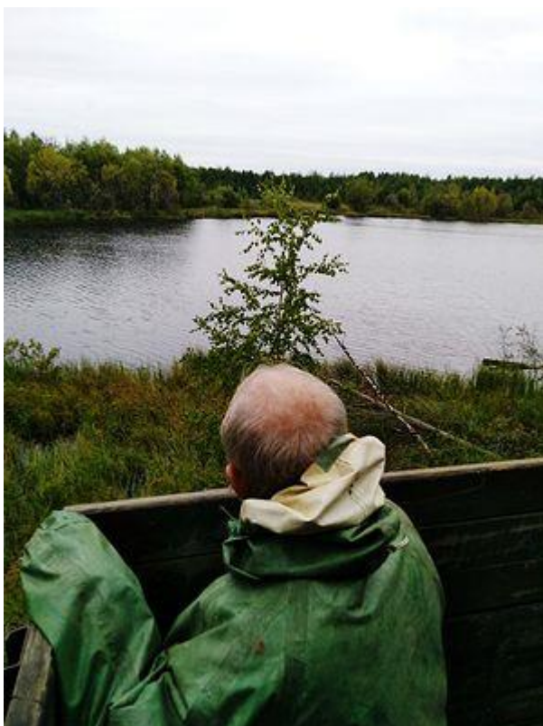
Озеро на ОЛП-6

Я пробовала сформулировать своё физическое состояние в конце этого пути. Вот что сформулировалось: «Из меня вытрясли душу». Вот тут-то я и вспомнила вчерашнюю роскошную поездку от Кирса до Лесного в микроавтобусе. Право слово – всё познаётся в сравнении! 9 часов душетряски – это серьёзное испытание. Могу смело заявить – мы достойно его прошли! Все пятеро!